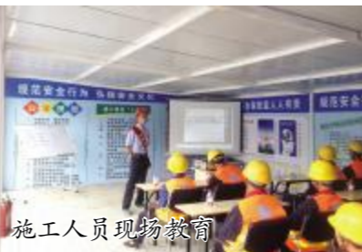
施工人员进行教育