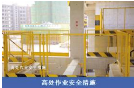
高处作业安全措施