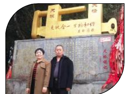
最美的不是旅行的风景，而是一起旅行的你