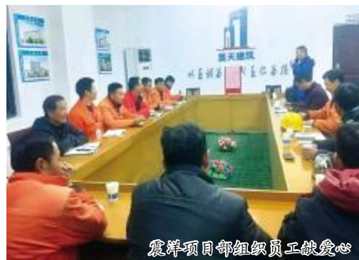
震洋项目部组织员工献爱心