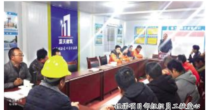
锂诺项目部组织员工献爱心