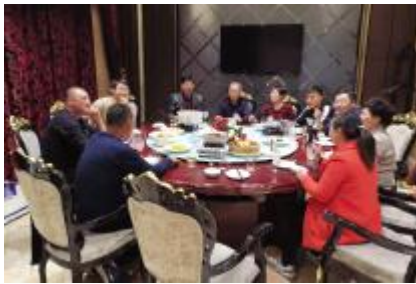
调皮的总是猝不及防的剪刀手