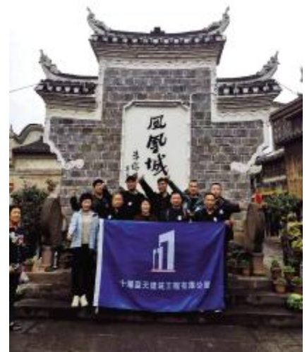
我能想到最浪漫的事，就是和你一起慢慢变老