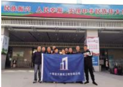
襄阳中转的接风宴